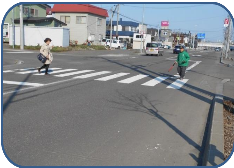
中原通りのさくら公園前横断歩道の様子

また、今回の交通指導員の方以外にも、今年度に入って、他の見守りボランティアの方々、数名が体の不調を訴えて、見守り活動に参加されていないことがしばしば見られました。見守り活動に関しては、ボランティアの方々に頼るところが大きい状況にあります。そんなボランティアの方々も高齢化が進み、いつまでも甘えていられない現状にあります。抜本的な対策を考えていかなければならないところですが、具体的な手立ては、今のところ思いつかない状況です。