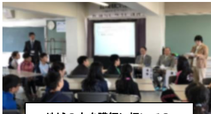
地域の方を講師に招いての「地域貢献を考える」道徳授業

固めていきたいと思えます。益々地域と学校のつながりの重要性が求められる中、地域が一体となり子ども達の活動を支援していきたいと考えます。今後ご理解とご支援をお願い致します。